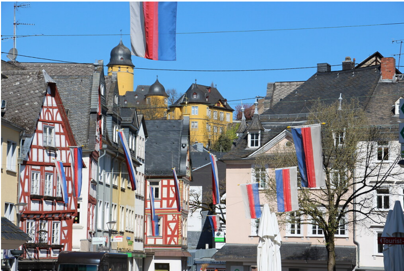
Blick auf das Schloss Montabaur von der Altstadt aus (2021)