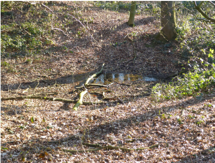
Quellteich am Hof Kiwitt (2022)