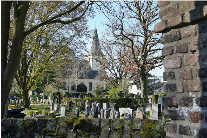
Blick über den Friedhof auf die alte Dorfkirche St. Cosmas und Damian in Weiler, heute Stadtteil Köln-Volkhoven/Weiler (2023).