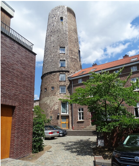
Stadt- und Stiftsmühle in Düsseldorf-Kaiserswerth (2020)