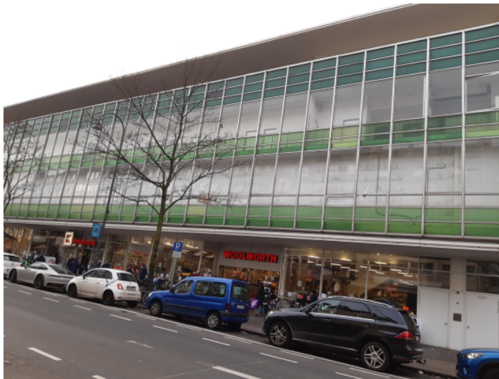
Fassade des ehemaligen Kaufhofs in Köln-Kalk (2021)