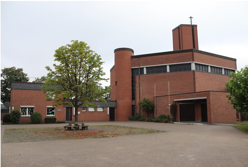
Katholische Kirche Sankt Mariä Namen in Esch (2022)