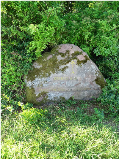
Ritterstein Nr. 229 „Stahlbuehl Ehem. Speyergau - Thingstaette“ östlich von Frankweiler (2020)