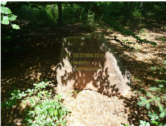
Ritterstein Nr. 227 "Alte Strasse Keltzeit - Mittelalter" nördlich von Hauenstein (2020)