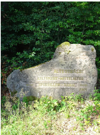
Ritterstein Nr. 226 "Alte Strasse Keltzeit - Mittelalter Spurrillen - Damm" nördlich von Hauenstein (2020)