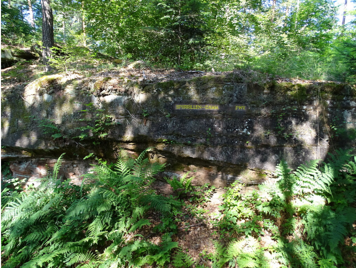
Ritterstein Nr. 225 "Spurrillen-Damm" nördlich von Hauenstein (2020)