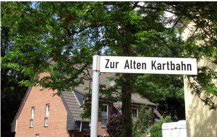
Straßennamensschild der heutigen Wohnstraße "Zur Alten Kartbahn" auf dem einstigen Areal der 1979 geschlossenen Kartrennstrecke in Kerpen-Horrem (2022).