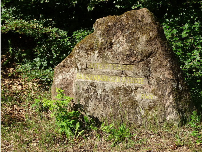
Ritterstein Nr. 224 Alte Strasse Falkenburger Steige nördlich von Falkenstein (2020)