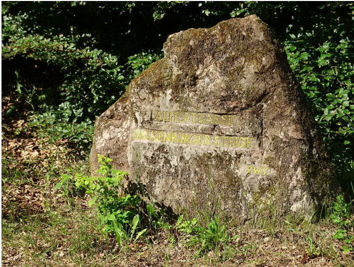
Ritterstein Nr. 224 Alte Strasse Falkenburger Steige nördlich von Falkenstein (2020)