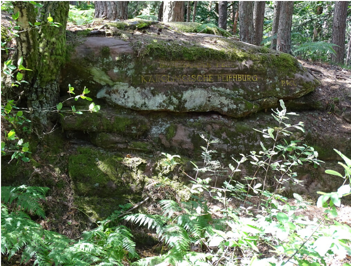
Ritterstein Nr. 219 Burghalder Fels Karolingische Fliehbürg südlich von Hauenstein (2020)