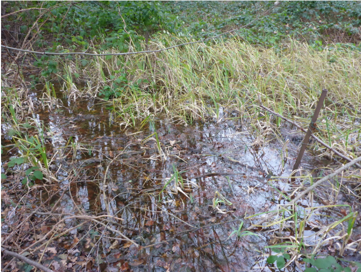
artesisches Quellwasser am Lackmannshof (2022)