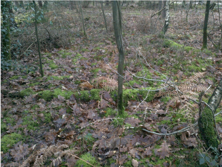
Quellbereich im Uedemer Hochwald (2020)