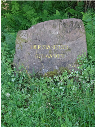
Ritterstein Nr. 217 „Hier stand der Schwanhof“ westlich von Lug (2020)