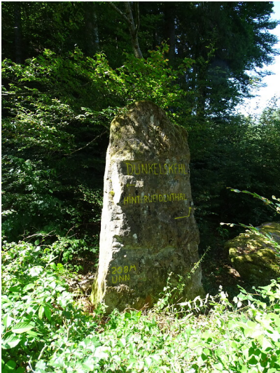
Ritterstein Nr. 216 Dunkelskehl 208 M üNN nordwestlich von Dahn (2020)