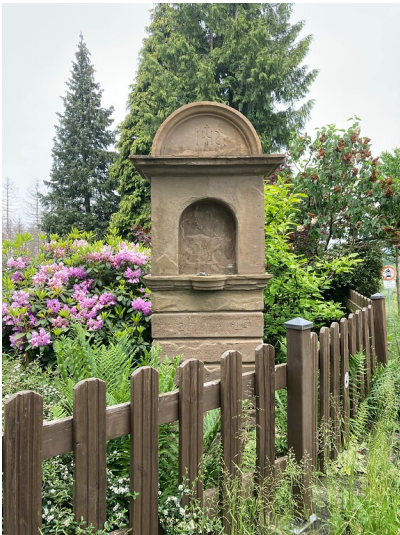
Station Nr. 7 des Fußfallwegs von Overath nach Marialinden (2021)