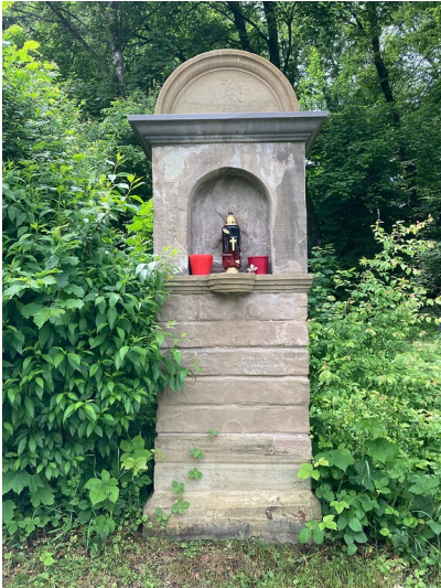
Station Nr. 6 des Fußfallwegs von Overath nach Marialinden (2021)