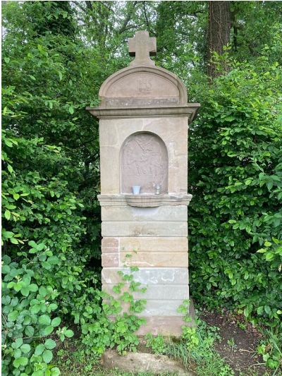
Station Nr. 4 des Fußfallwegs von Overath nach Marialinden (2021)