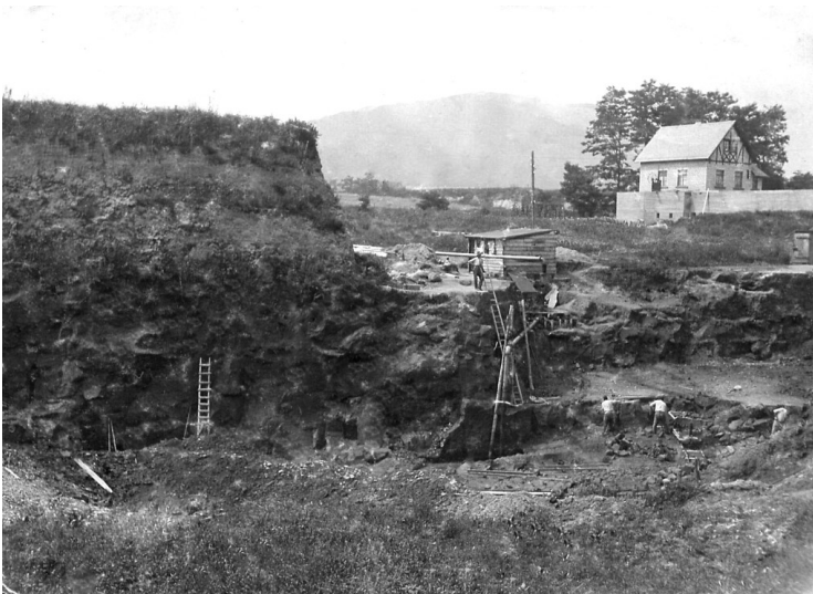
Blick auf die Grube Haans Loch in Plaidt, in der Tuffstein im Tagebau gewonnen wurde (1911)