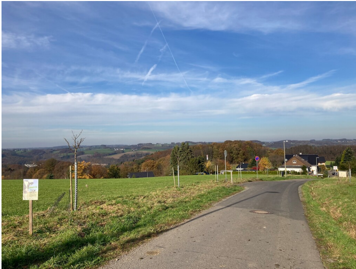
Ausblick auf das Aggertal von der Obstbaum-Allee in Overath-Marialinden (2021)