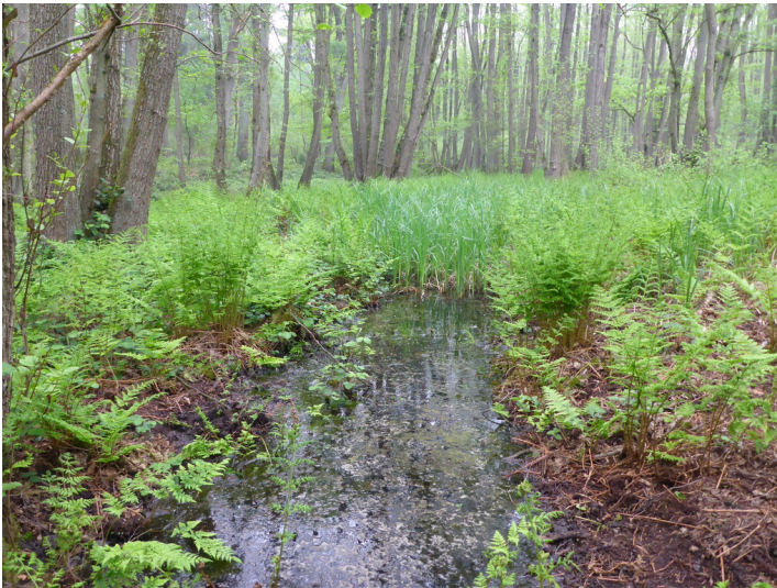
Quelle nordöstlich des Römerbachs (2019)