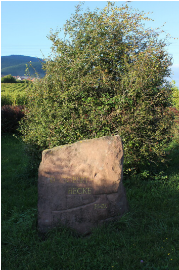
Ritterstein Nr. 183 "Dagobert-Hecke" südlich von Frankweiler (2021)