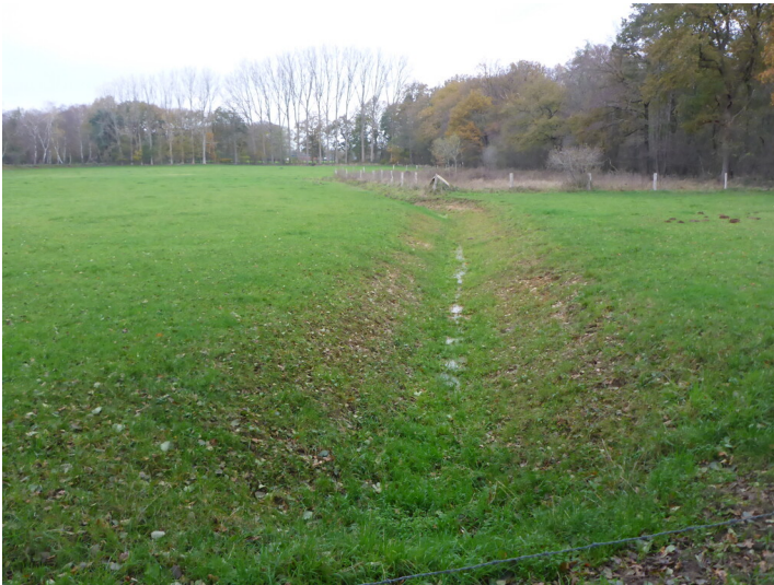
Graben auf Feld am Holländerdeich (2020)