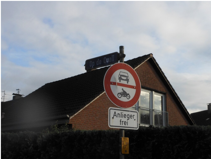
Straßenschild „Op de Quell“ (2019)