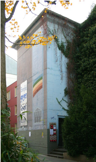
Der Hochbunker an der Körnerstraße in Köln-Ehrenfeld (2011)