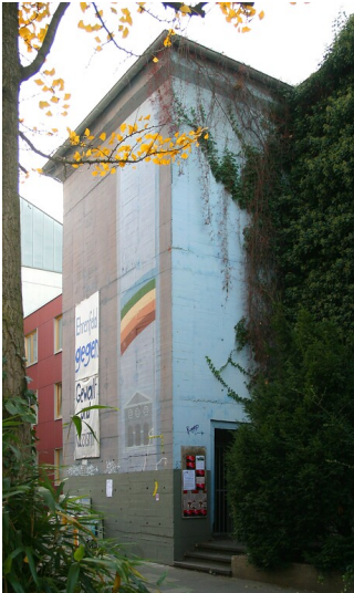
Der Hochbunker an der Körnerstraße in Köln-Ehrenfeld (2011)