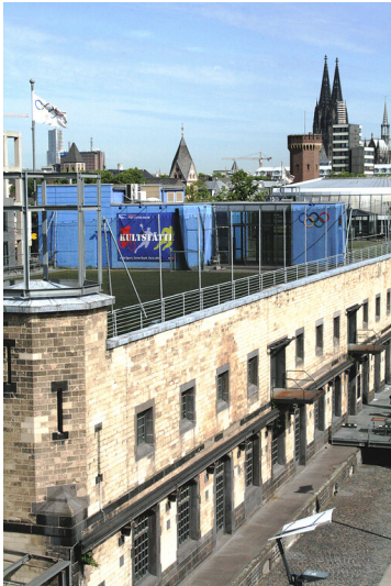
Das Deutsche Sport & Olympia Museum am Rheinauhafen in Köln-Altstadt-Süd mit Blick auf den Dom (2011).