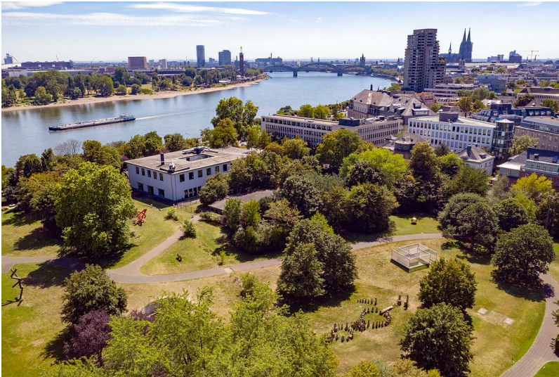
Luftbildaufnahme des Skulpturenparks Köln in Neustadt-Nord (2020).