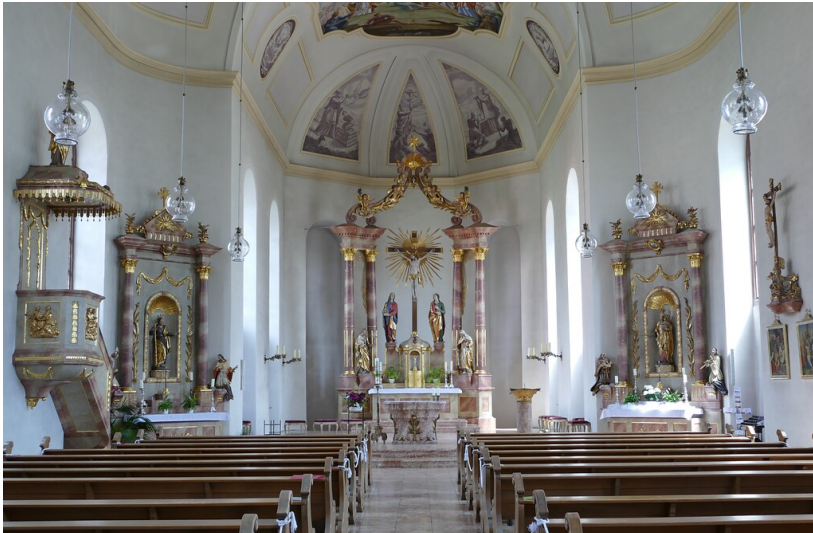
Der Innenraum der katholischen Pfarrkirche Kreuzerhöhung in Kirrweiler (Pfalz) (2021)