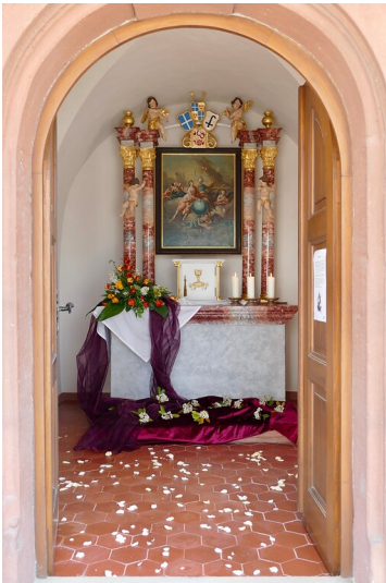
Blick in den Innenraum der Dreifaltigkeitskapelle in Kirrweiler (Pfalz) (2021)