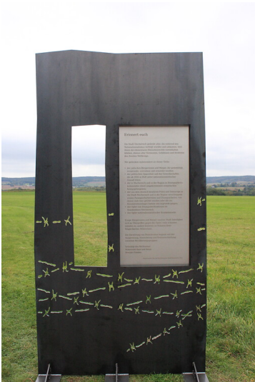
Bild 4: Die Metallstele nach ihrer Fertigstellung