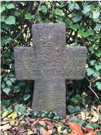
Grabstein in Form eines Kreuzes von 1644 des Töpfers Adam Uhlis mit Töpferschiene (2021)