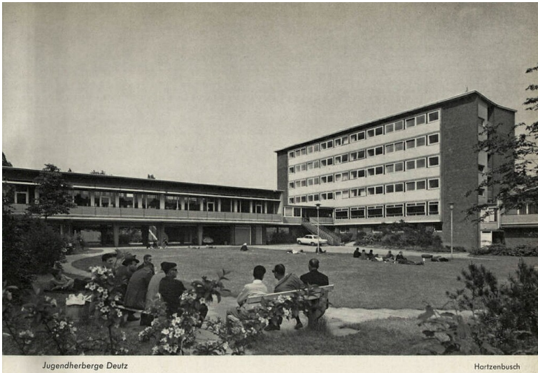
Foto der Jugendherberge in Köln-Deutz im Verwaltungsbericht der Stadt Köln 1963.