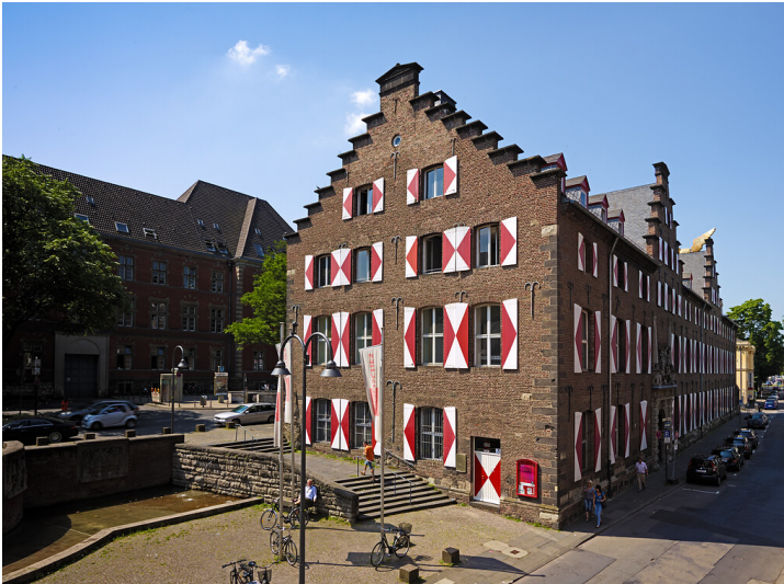
Das Zeughaus und Sitz des Kölnischen Stadtmuseums bis 2021/22 von Nordosten aus gesehen (2013).