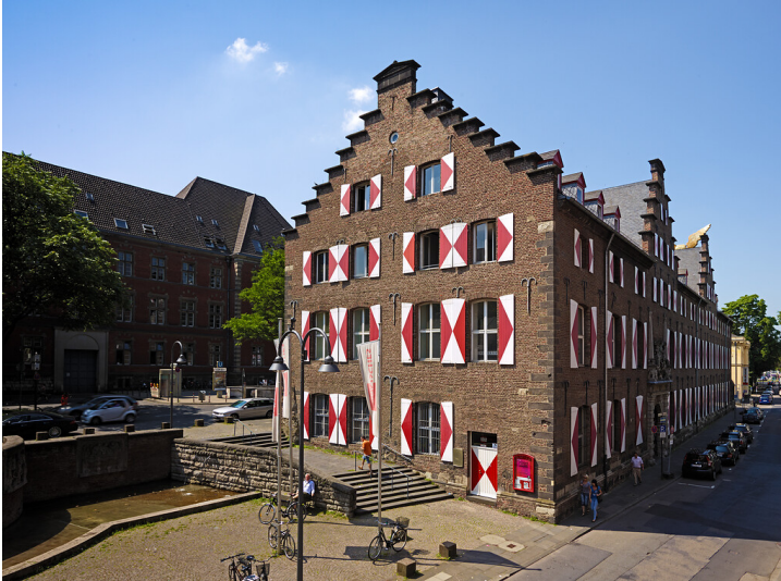
Das Zeughaus und Sitz des Kölnischen Stadtmuseums bis 2021/22 von Nordosten aus gesehen (2013).