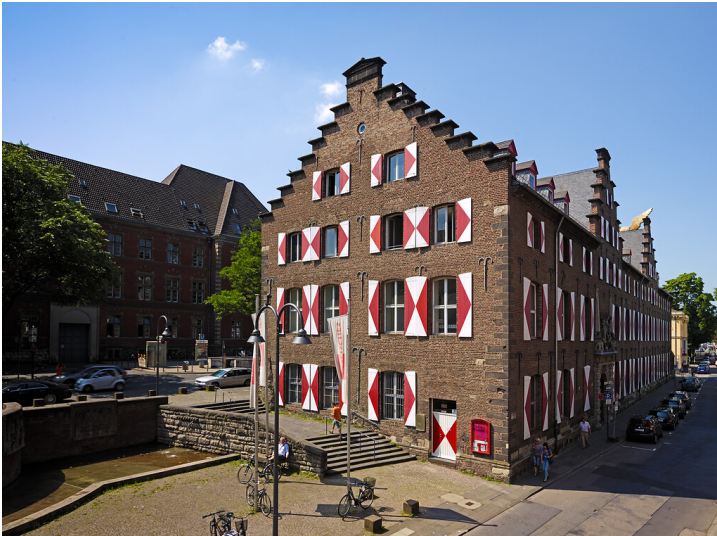
Das Zeughaus und Sitz des Kölnischen Stadtmuseums bis 2021/22 von Nordosten aus gesehen (2013).