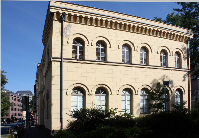
Die Alte Wache in der Zeughausstraße in Köln-Altstadt-Nord (2010).