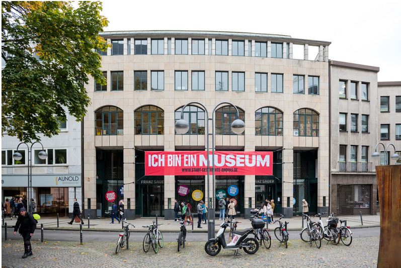
Das ehemalige Modehaus "Franz Sauer" in der Minoritenstraße in der Kölner Altstadt-Nord und ab 2021/22 neuer Sitz des Kölnischen Stadtmuseums (2021).