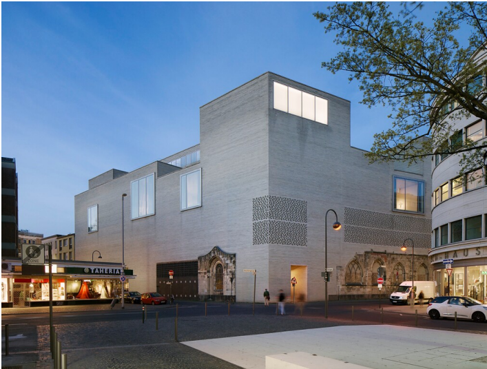
Das Kunstmuseum des Erzbistums Kölns "Kolumba", entworfen vom Schweizer Architekten Peter Zumthor, in Köln-Altstadt-Nord (2014).