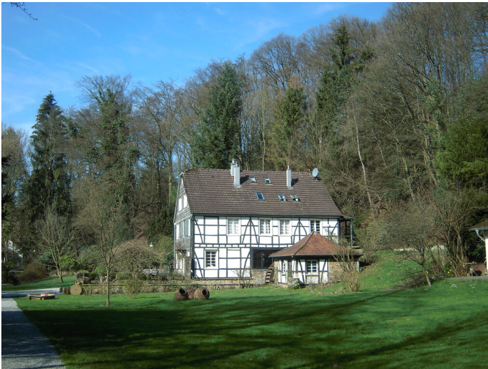
Die Wassermühle Ernenkotten im Tal der Itter mit Nebengebäude und Wasserrad (2019)