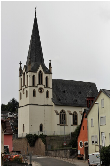
Die Evangelische Kirche in Laubenheim von der Naheweinstraße aus (2021)