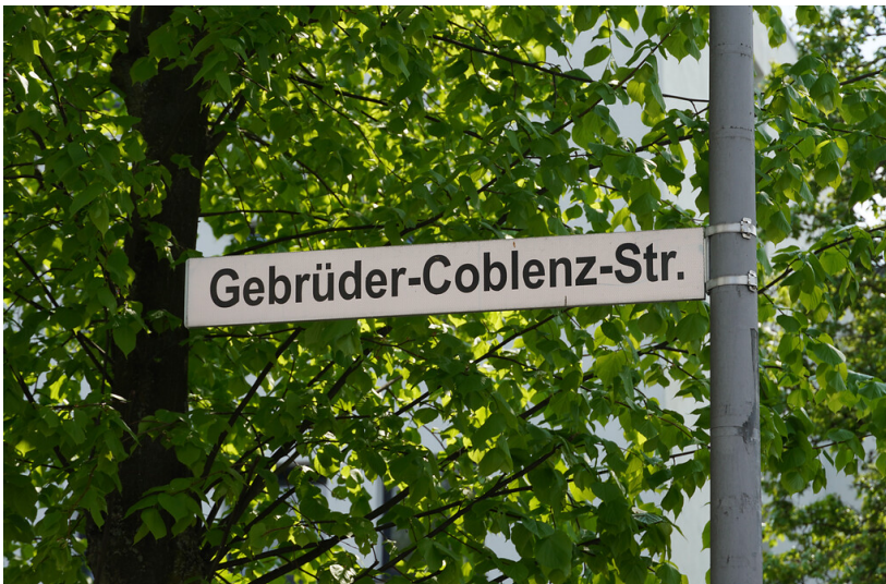
Straßenschild "Gebrüder-Coblenz-Straße" in Köln-Deutz (2022)