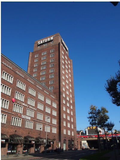
Das Hansahochhaus in Köln vom Hansaring aus gesehen (2021).