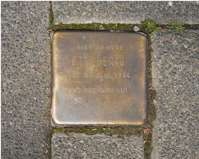
Stolperstein zur Erinnerung an Otto Gerig in Köln-Deutz (2022)