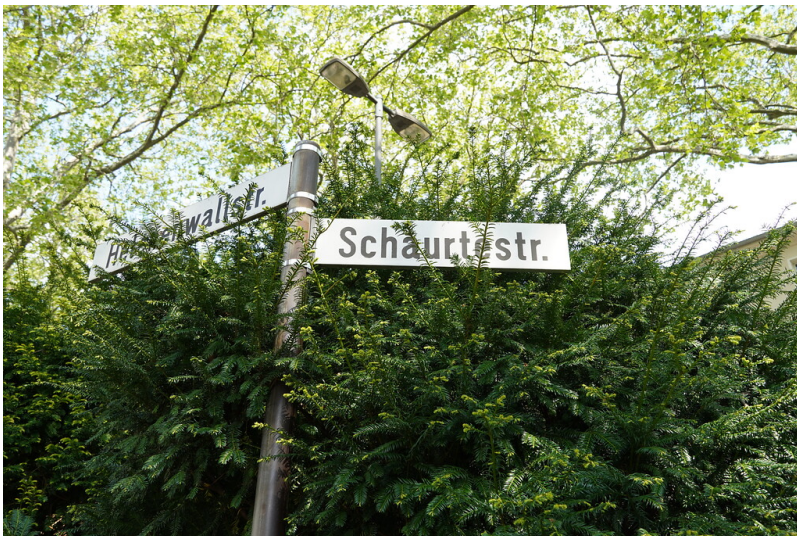
Straßenschilder "Helenenwallstraße" und "Schaurtestraße" in Köln-Deutz (2022)