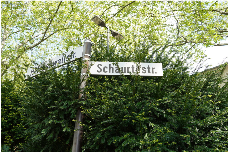
Straßenschilder "Helenenwallstraße" und "Schaurtestraße" in Köln-Deutz (2022)