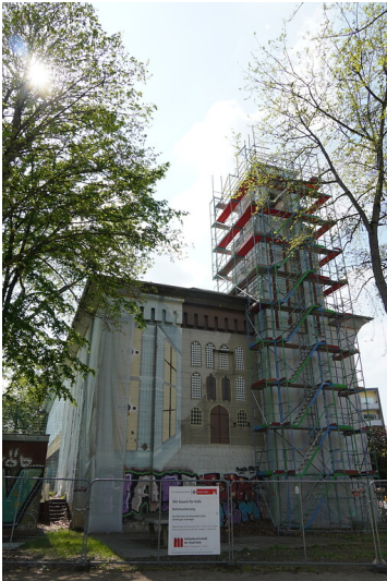
In Sanierung befindlicher Hochbunker in Köln-Deutz (2022)