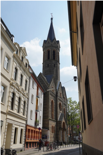
Evangelische Kirche St. Johannes in Köln-Deutz (2022)